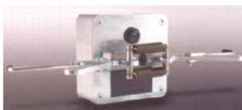
Laserenhed med måleskala finder retning af ACC sensor (for oven). Adapter for Wabco ACC sensortype