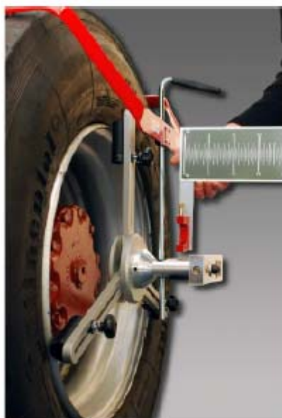
Refleksionsskalaer monteres på drevakslen