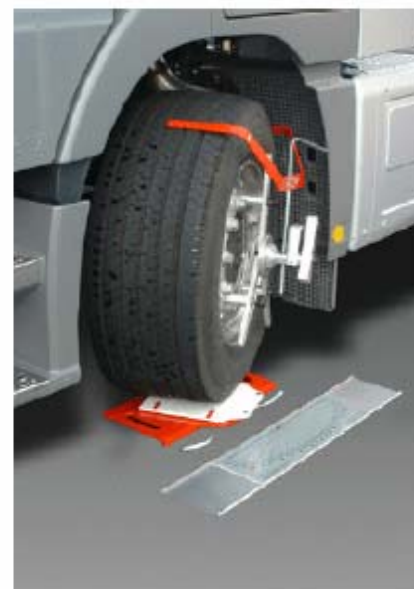
HD-30 EasyTouch lasersystem anvendes til måling af drevaksleretning